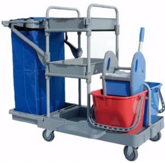
STARACE 102 CODICE CARR00390 - IP06

BASE CON 4 RUOTE IN GOMMA (SUPPORTO IN METALLO) Ø 100 MM PIANTONE VERNICIATO CON FORI CENTRALI SUPPORTO PORTA ACCESSORI IN FIBRA DI VETRO CON ATTACCO A CODA DI RONDINE PORTASACCO 120 LT. (COMPLETO DI BLOCCASACCO E RINFORZI LATERALI) SUPPORTO VASCHETTA IN POLIPROPILENE SUPPORTO PER BASE REGGISACCO VASCHETTA IN POLIPROPILENE SUPPORTO STRIZZATORE SECCHIO 15 LT. SECC00055 0615 STRIZZATORE NEW LINE/STRONG PORTA MANICO BASE REGGISCOPA MOSTRINA IN NYLON TAPPO COPRIFORO PER BASE SACCO 120 LT. Optional