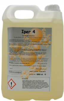
IPER 4 Profumato