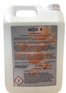
ACCA 4 Inodore