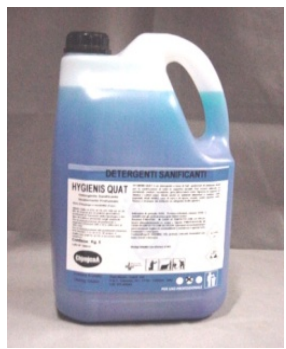
HYGIENIS QUAT Profumato e Inodore

Questi prodotti non danneggiano alcun tipo di superficie.