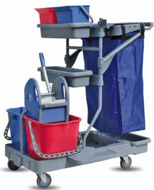
STARACE 105 CODICE CARR00666 - IP06

BASE CON 4 RUOTE IN GOMMA (SUPPORTO IN METALLO) Ø 100 MM PIANTONE VERNICIATO CON FORI CENTRALI CLIP IN POLIPROPILENE PER PIANTONE SUPPORTO PORTA ACCESSORI IN FIBRA DI VETRO CON ATTACCO A CODA DI RONDINE SUPPORTO PORTA ACCESSORI IN FIBRA DI VETRO CON DOPPIO ATTACCO A CODA DI RONDINE PORTASACCO 120 LT. (COMPLETO DI BLOCCASACCO E RINFORZI LATERALI) VASCHETTA IN POLIPROPILENE - TIPO 3 SUPPORTO STRIZZATORE SECCHIO 15 LT. SECCHIO 6 LT. STRIZZATORE NEW LINE/STRONG PORTA MANICO BASE REGGISCOPA MOSTRINA IN NYLON TAPPO COPRIFORO PER GAMMA CARRELLI / MULTIUSO SACCO 120 LT. Optional