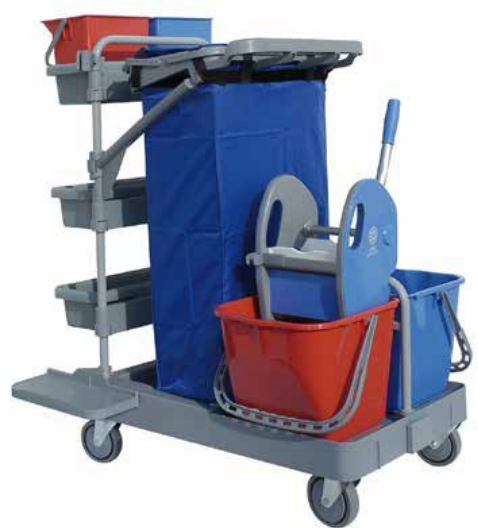
STARACE 103 CODICE CARR00637 - IP06

BASE CON 4 RUOTE IN GOMMA (SUPPORTO IN METALLO) Ø 100 MM PIANTONE VERNICIATO CON FORI CENTRALI SUPPORTO PORTA ACCESSORI IN FIBRA DI VETRO CON ATTACCO A CODA DI RONDINE PORTASACCO 120 LT. (COMPLETO DI BLOCCASACCO E RINFORZI LATERALI) SUPPORTO VASCHETTA IN POLIPROPILENE SUPPORTO PER BASE REGGISACCO VASCHETTA IN POLIPROPILENE SUPPORTO STRIZZATORE SECCHIO 15 LT. SECC00055 0615 STRIZZATORE NEW LINE/STRONG PORTA MANICO BASE REGGISCOPA MOSTRINA IN NYLON TAPPO COPRIFORO PER BASE SACCO 120 LT. Optional